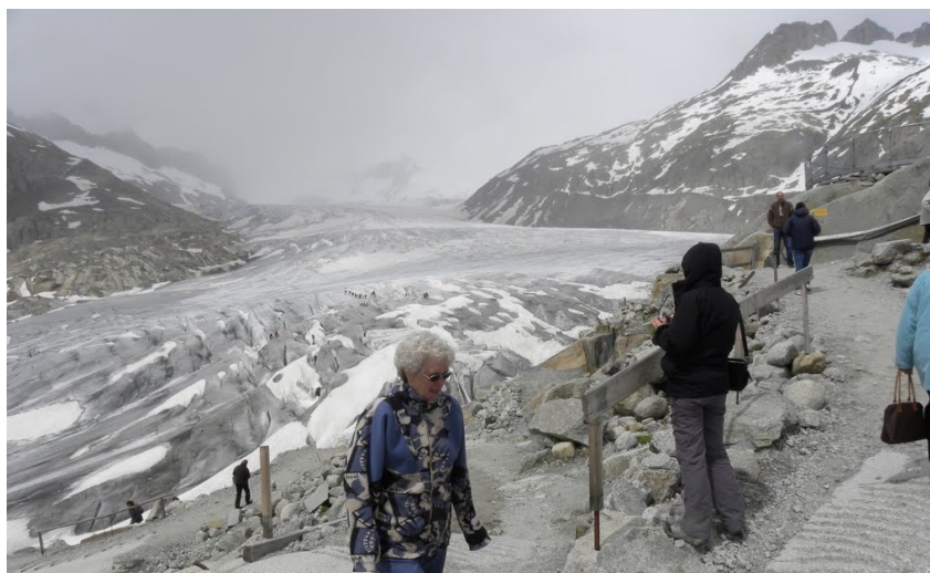
Le glacier du Rhône.

Un sondage sera fait auprès des membres pour connaître le nombre de personnes intéressées par cette excursion. En fonction des réponses, la randonnée sera maintenue et le moyen de déplacement choisi. Si elle n'a pas lieu, elle sera remplacée par une balade (date à préciser) d'une demi-journée dans le massif des Brasses (Pte de Miribel, Plaine-Joux).