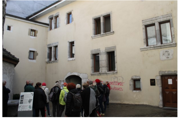
A gauche : départ de la balade devant l'hôtel de ville. A droite : la maison Boniface et ses inscriptions latines.