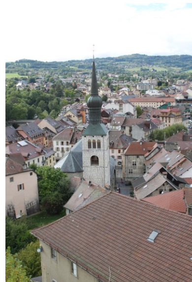
A gauche : l'église Saint-Jean-Baptiste. Au milieu : entrée de la tour des comtes de Genève. A droite : vue depuis le sommet de la tour des comtes de Genève.

Ensuite le groupe prit la direction de la Bénite Fontaine dont l'origine remonte vraisemblablement au 16 ème siècle lors des grandes épidémies de peste.