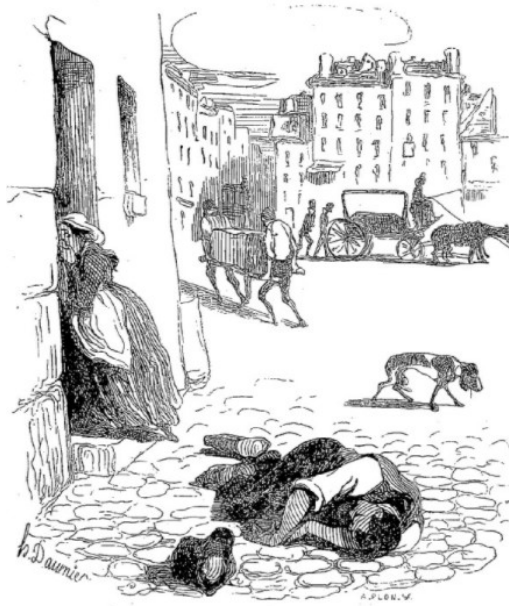
Source : Fabre F. Némésis médicale illustrée : Souvenirs du choléra-morbus. 1840.

Le choléra est une maladie diarrhéique épidémique, strictement humaine, due à la bactérie Vibrio cholerae . Elle a été découverte par Filippo Pacini, un anatomiste italien, en 1854 puis isolée en 1883 par Robert Koch, un médecin allemand. Ce dernier détermine aussi sa transmission à l'Homme : à travers l'eau. Il met au point des mesures préventives qui vont permettre de freiner la propagation de cette pandémie.