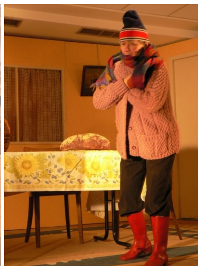
Toutes les photos : © Bernard Boccard.