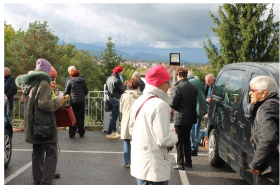
A gauche : la chapelle de la Bénite Fontaine. A droite : le traditionnel goûter de la fin de la balade devant la chapelle.