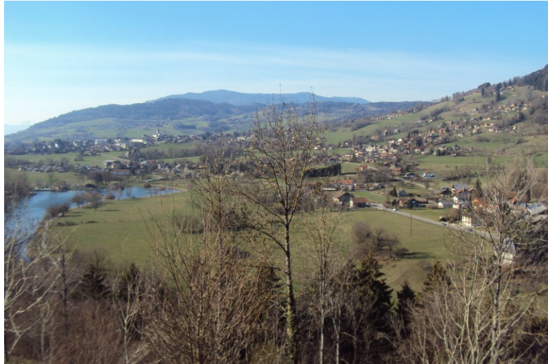
A gauche : chapelle du calvaire.