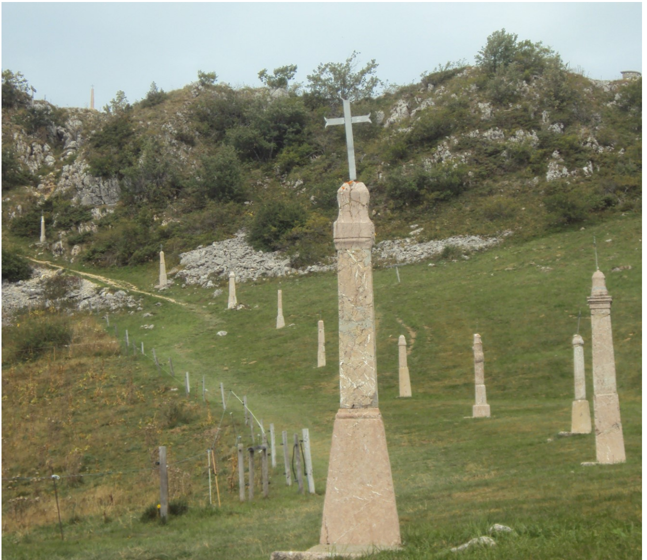
Chemin de croix de la Pointe de Miribel