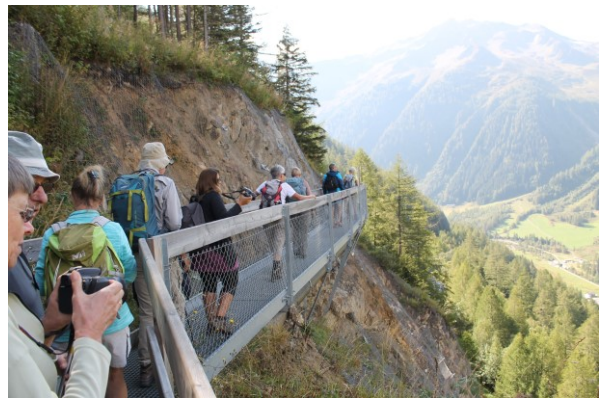
A gauche : départ du sentier du bisse.